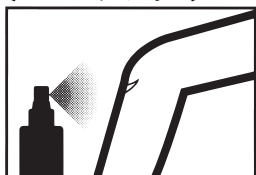
転んですりむいた時