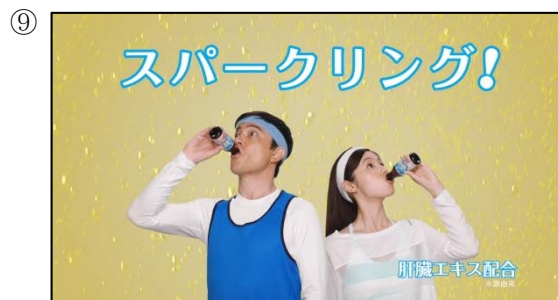
シュワー スパークリング